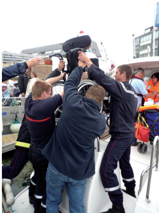
Le transfert des fauteuils roulants sur les bateaux a angoissé quelque peu les mamans.

L'événement a nécessité un encadrement très précis. "Il y avait une quarantaine de bénévoles." Les plaisanciers du port qui avaient mis leurs bateaux à disposition de l'opération, la SNSM, les pompiers, la société des régates de Courseulles-sur-Mer et le club de plongée d'Arromanches ont immédiatement répondu à la demande de l'association. La balade a en effet nécessité une organisation assez complexe. "La sécurité devait être à son maximum. En