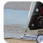
Spot : chars à la fête dans le Bessin Page 2